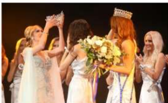
Bývalá královna krásy se musela vzdát své korunky a nezbylo jí nic na památku.

I v té nezbytečnější a nejobyčejnější Miss dívky alespoň dostanou novou korunku, tady se bývalé vítězky musely svých korunek vzdát a dát je dalším dívkám. Takže jim ani památku nic nezbylo, jen vzpomínky na rok „kralování“, kdy o nich nebylo ani vidu, ani slechu.